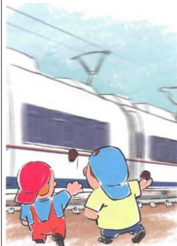
Не повреждай железнодорожный подвижной состав!

Не повреждай, не загрязняй, не загромождай, не снимай, самостоятельно не устанавливай знаки, указатели или иные носители информации!