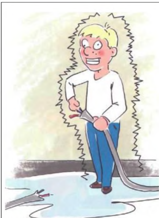
Не приближайся к оборванным проводам!

Не повреждай оборудование железнодорожного транспорта!